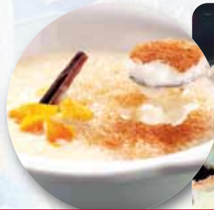
ARROZ CON LECHE