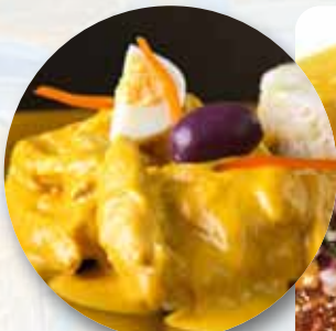
AJÍ DE GALLINA