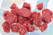
Crujiente de frambuesa