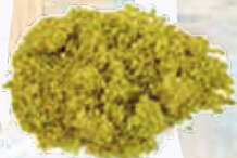
Tierra de Pistacho