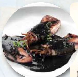
CHIPIRON EN SU TINTA