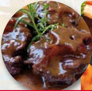
RABO DE TORO