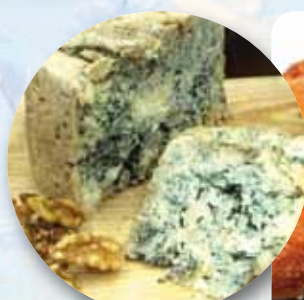
CABRALES Y NUEGES