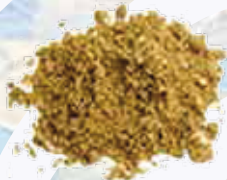
Tierra de aceituna verde