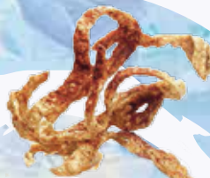
Granulado de corteza de cerdo