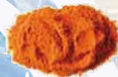
Polvo de pimiento asado