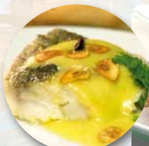
BACALAO AL PILPIL