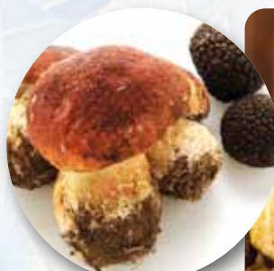
BOLETUS Y TRUFA