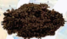
Tierra de aceituna negra