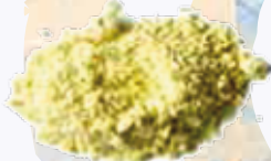
Polvo de fruta de la pasión