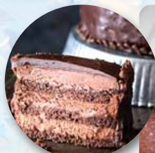
CHOCOLATE Y TRUFA