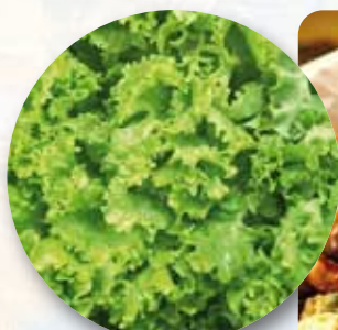
LECHUGA AL ALILLO