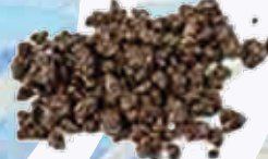
Peta de chocolate negro